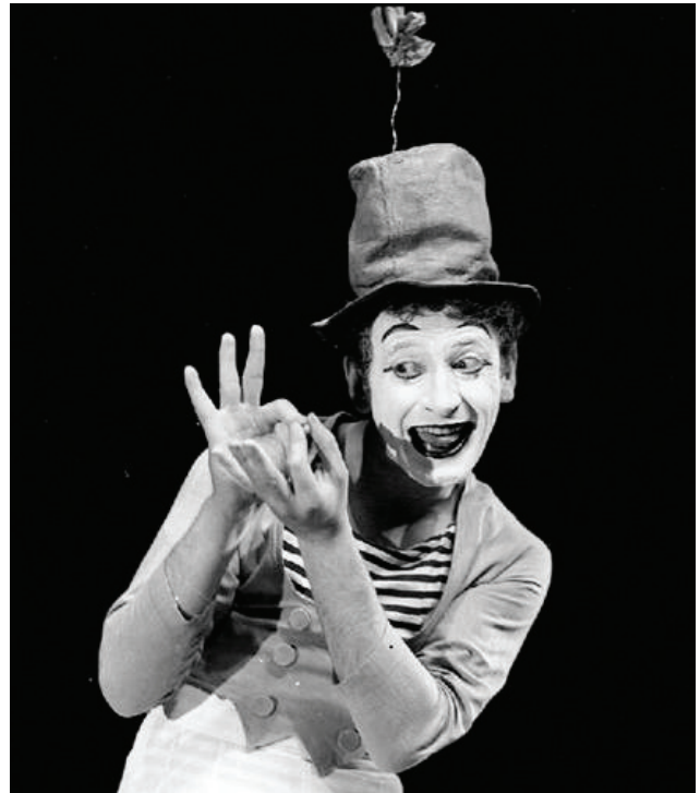
Le mime Marcel Marceau

Et s'il faut un jour donner mon nom à un championnat, je souhaite qu'il se pratique à deux armes : à l'Épée et au Champagne !